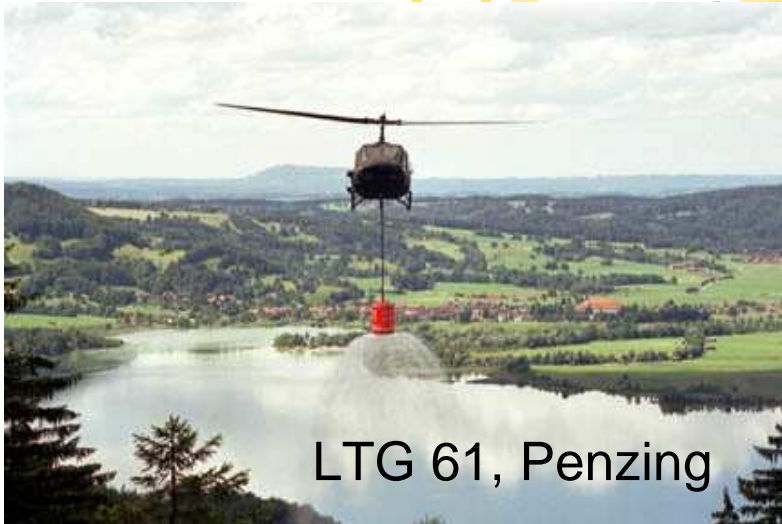
LTG 61, Penzing