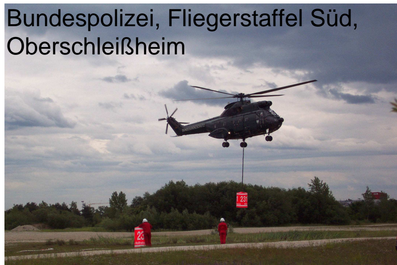
Bundespolizei, Fliegerstaffel Süd, Oberschleißheim